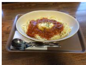
■本日のスパゲティ