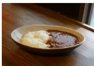
■カレーライス ・印度風チキンカレー ・印度風キーマカレー ・欧風ビーフカレー